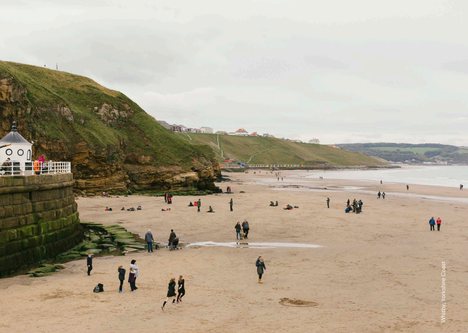
Whitby, Yorkshire Coast