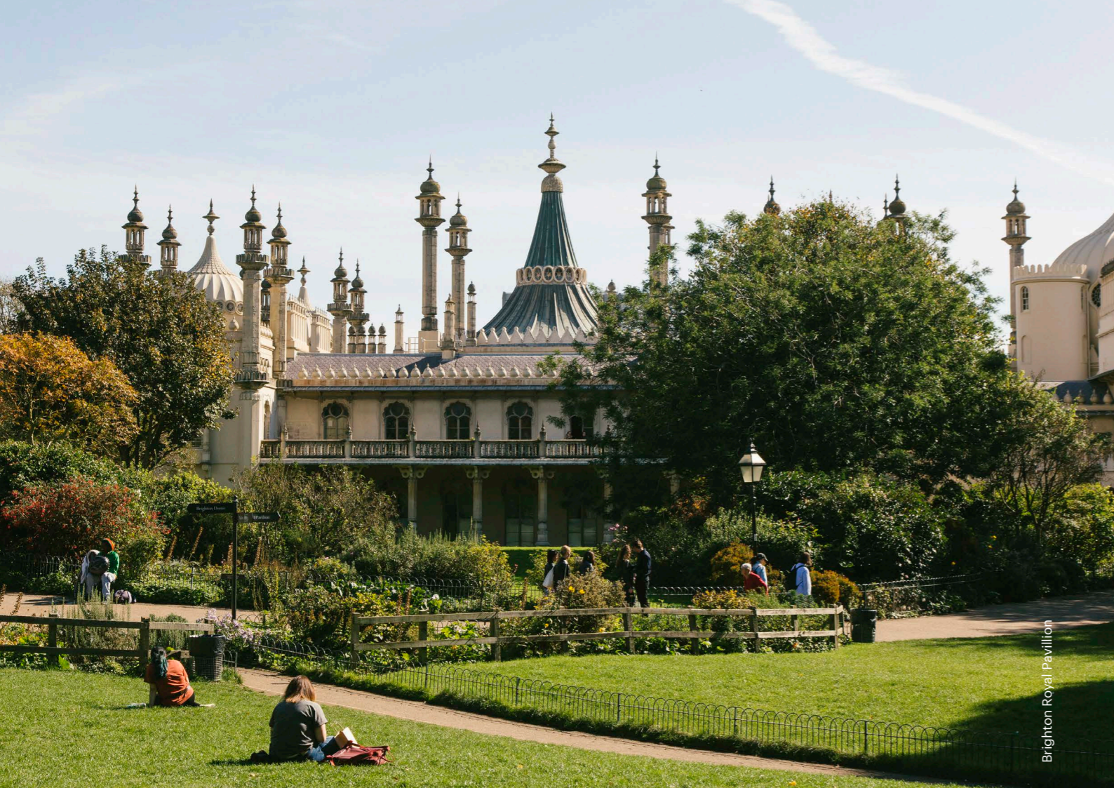
Brighton Royal Pavilion